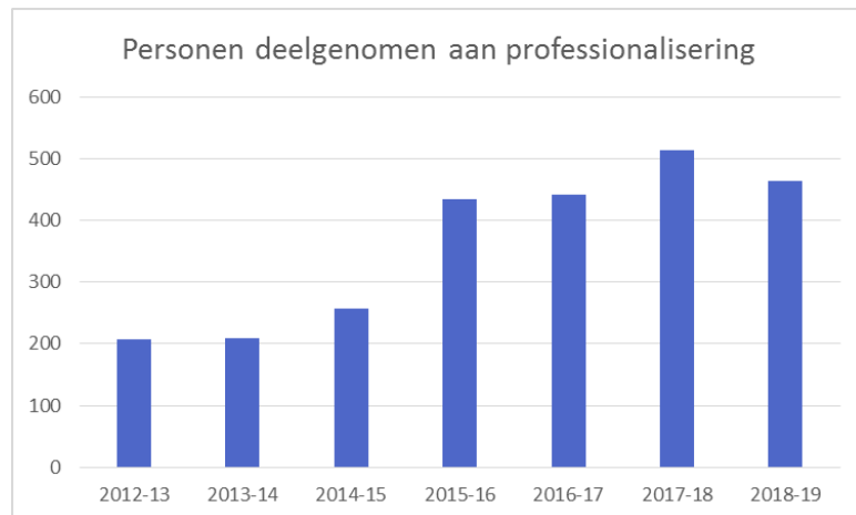
Grafiek E2 – Aantal dagdelen ingezet voor professionaliseringsactiviteiten sinds schooljaar 2012 – 2013