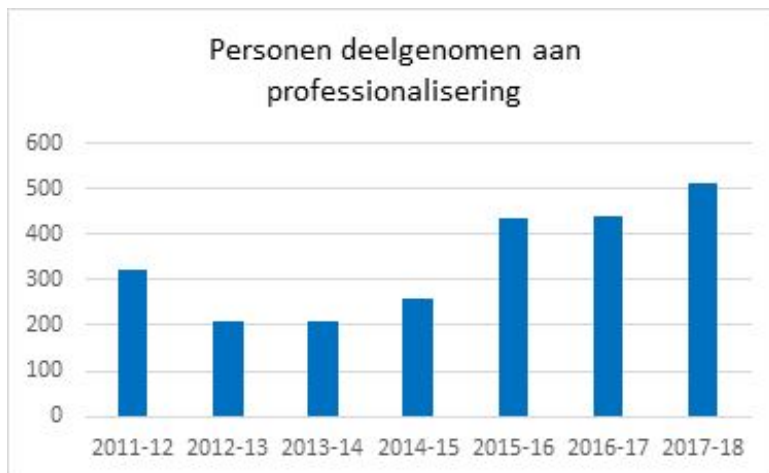
Grafiek E2 – Aantal dagdelen ingezet voor professionaliseringsactiviteiten sinds schooljaar 2011 – 2018